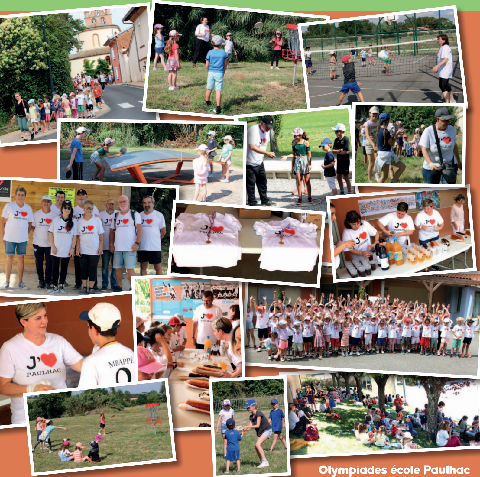
Olympiades école Paulhac