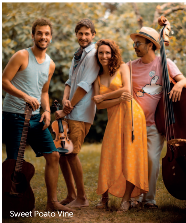
Sweet Potato Vine

Le samedi 3 mai, à 20h30, à la salle des fêtes, venez découvrir le groupe Sweet Potato Vine ,