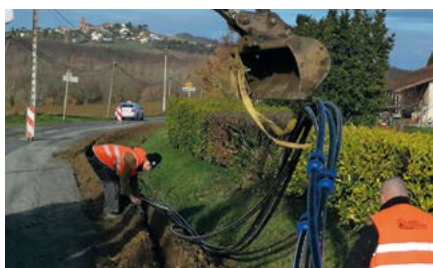
Pose des fourreaux en attente de la fibre optique, posée ultérieurement

près de 500. En novembre 2020, un Sous-Répartiteur Optique, armoire de brassage qui desservira les futurs abonnés, a été installé. Les premiers travaux de construction du réseau débiteront ce mois de janvier afin de permettre les abonnements en 2022. A ce stade du projet seule l'année 2022 peut être annoncée. Un calendrier plus précis sera disponible dans le courant de cette année.