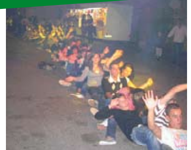
14 au 17 août Fête de Paulhac – Comité des Fêtes