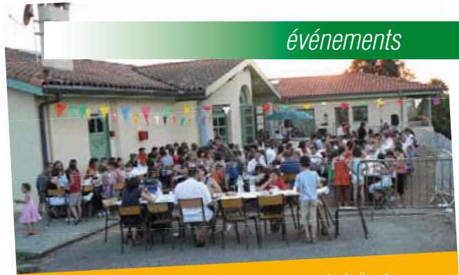
21 juin Fête de la musique – Amicale Laïque