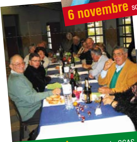
16 novembre Repas du CCAS