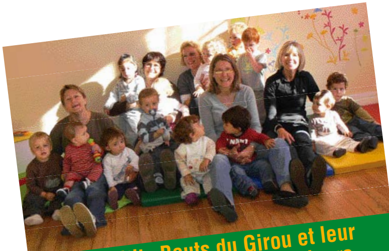
Les P'tits Bouts du Girou et leur nounous vous présentent leurs meilleurs vœux pour 2009