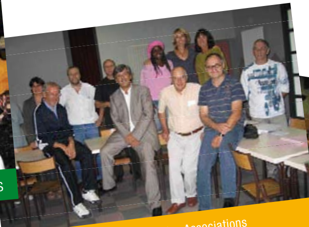
12 septembre Forum des Associations