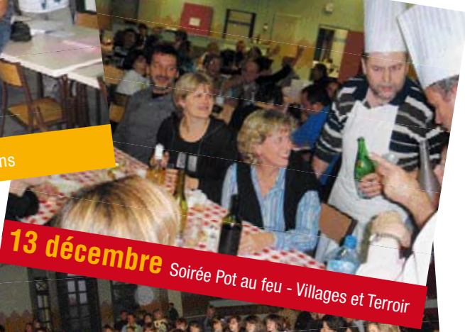
13 décembre Soirée Pot au feu - Villages et Terroir