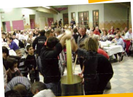
22 novembre Soirée aligot - Comité des Fêtes