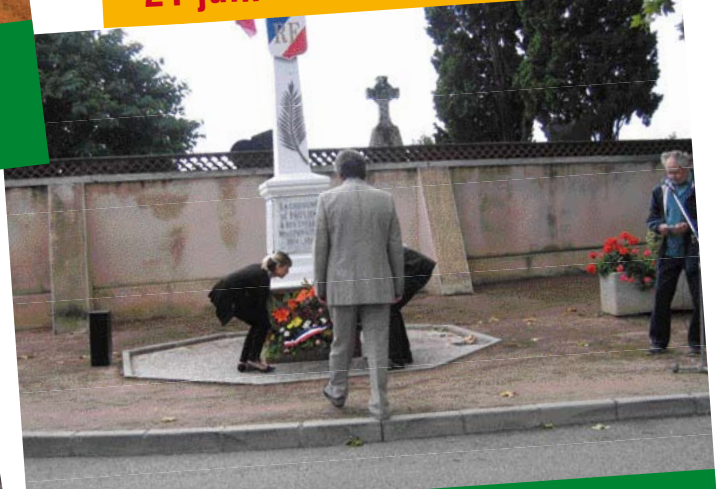
15 août Dépôt de gerbe au monument aux morts de Paulhac