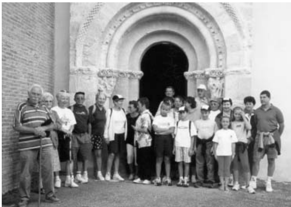
Photo prise lors d'une sortie vers Gemil

La section "Chemins de randonnées" de Créatisiasmes a le plaisir de vous présenter, à l'occasion de cette nouvelle année, ses meilleurs vœux.