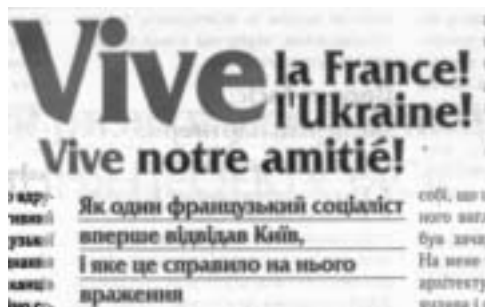
Photo de D. Cujives reçu par A. Kimlach, Maire de Vychgorod (22.08.01) et extrait de l'article ukrainien publié à l'occasion.