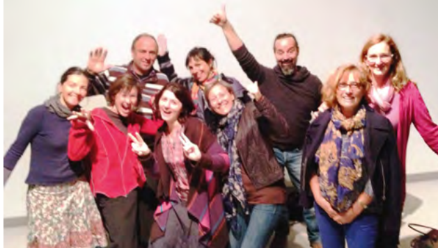
Le groupe Mandalas

C'est quoi le chant diphonique ? C'est une technique de chant pratiquée dans différents endroits du monde qui permet d'émettre deux sons en même temps avec une seule voix. Unique et original, le