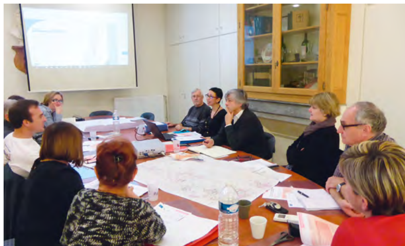
Le conseil municipal en réunion de travail.

La Commune approuve l'Agenda d'Accessibilité programmée (Ad'AP) afin de respecter, sur une période de 3 ans, ses obligations de mise en accessibilité des établissements recevant du public.