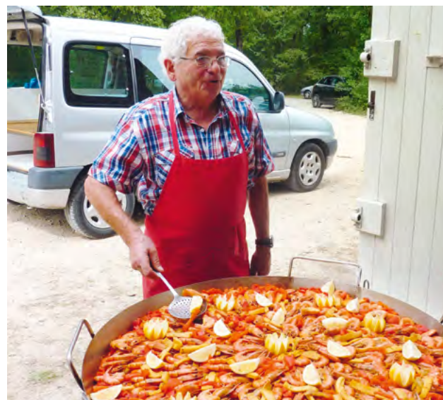
Ils ont ensuite apprécié la paëlla géante.

Préparez-vous pour la prochaine rando à l'automne 2016.