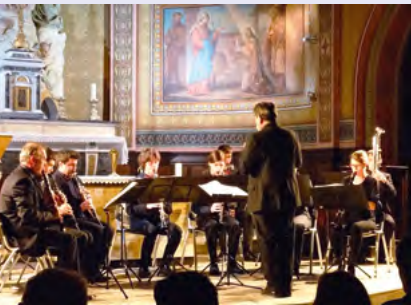
L'Ensemble des Clarinettes de Toulouse

VOUS ÊTES TOUJOURS TRÈS NOMBREUX À ASSISTER AUX CONCERTS