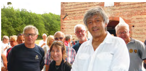
L'apéritif a réuni tous les marcheurs et accompagnants

Belle réussite pour la Rando du Poutou. Cent soixante randonneurs se sont inscrits pour ce parcours qui a l'avantage d'offrir une distance à la carte. De Launaguet à Paulhac, 23 kilomètres mais de nombreux points de rendez-vous dans les villages traversés où les marcheurs peuvent se joindre au cortège. Des chemins qui permettent de voir nos campagnes d'un autre œil, mais qui, aux dires de nombreux randonneurs, « montent et descendent ! ».