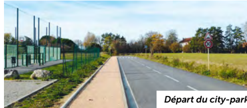
Départ du city-park