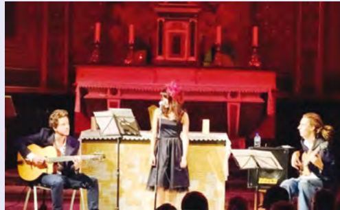
Black And White Trio