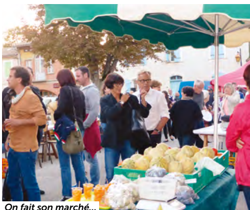
On fait son marché...

Ambiance de fête en arrivant ce 18 septembre à la table gourmande avec Los Bomberos . Dès 19 heures, de nombreuses personnes se rassemblent sur la place des Tilleuls pour cette table ou si l'on préfère, marché gourmand : chacun choisit ce qu'il veut manger, pour la viande et les légumes, les producteurs cuisent sur place, l'aligot « file » en direct. les charcuteries, entrées salées, fruits, gâteaux, il y a largement de quoi se préparer un menu de choix. Le comité des fêtes s'occupe de la buvette et des barquettes de frites et le groupe Mambo Bidon , assure l'animation en fin de soirée.