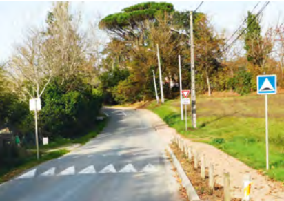
Départ du boulodrome

Le Panorama, au city park et au boulodrome, la voirie a pris un coup de jeune !