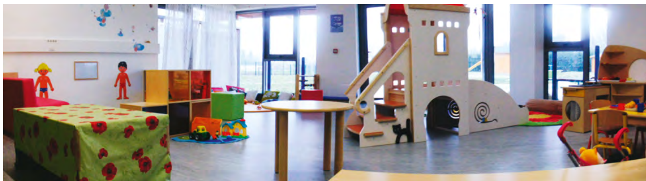
Photo prise à hauteur des yeux d'enfants, c'est ce qu'ils voient en arrivant dans la salle.

Plus d'informations sont données sur les derniers bulletins d'information de la Communauté de Communes des Coteaux du Girou ou sur le site www.cc-coteaux-du-girou.fr