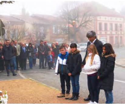
Dans le brouillard, moment de recueillement