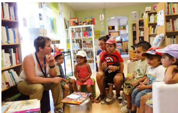
La bibliothèque accueille les enfants de l'ALSH

L'équipe de la bibliothèque vous propose de rejoindre son cercle des lecteurs pour partager avec d'autres les joies, émotions et frissons que vous avez pu ressentir à la lecture d'un livre. Le vendredi 5 février le cercle des lecteurs se retrouvera autour d'un thème: les douleurs de l'histoire et fin mai autour de livres écrits par une femme. Les dates seront confirmées par mails à nos adhérents, par voie d'affiches et sur le site de la mairie. N'oubliez pas de vérifier et venez, adhérents ou non adhérents, avec votre livre coup de cœur sur le thème proposé. Nous nous réunissons le vendredi à partir de 18 h 30.