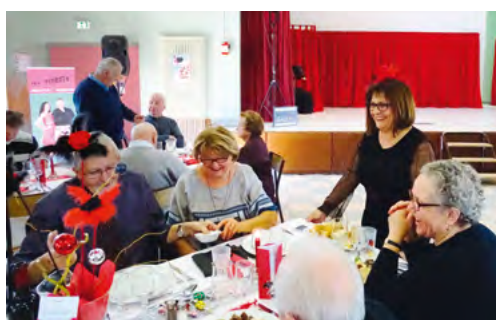
Convivialité et bonne humeur