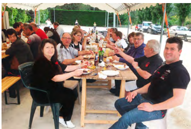
Convivialité, sport et jeux, c'est la Pétanque paulhacoise

La Pétanque paulhacoise a préparé de grandes rencontres, comme vous pourrez en juger :