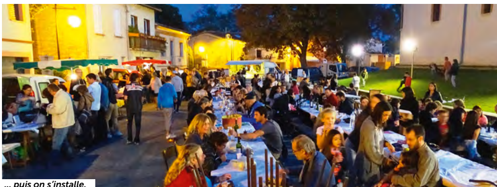
... puis on s'installe.

Ambiance de fête en arrivant ce 18 septembre à la table gourmande avec Los Bomberos . Dès 19 heures, de nombreuses personnes se rassemblent sur la place des Tilleuls pour cette table ou si l'on préfère, marché gourmand : chacun choisit ce qu'il veut manger, pour la viande et les légumes, les producteurs cuisent sur place, l'aligot « file » en direct. les charcuteries, entrées salées, fruits, gâteaux, il y a largement de quoi se préparer un menu de choix. Le comité des fêtes s'occupe de la buvette et des barquettes de frites et le groupe Mambo Bidon , assure l'animation en fin de soirée.