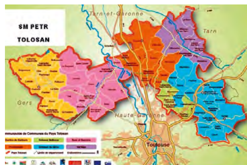
le PETR Tolosan réunit 72 communes pour 105 000 habitants

Ce syndicat mixte Pôle d'Equilibre Territorial et Rural est un syndicat mixte fermé : ce sont uniquement les communautés de communes qui en sont membres : il s'agit des communautés de communes des Coteaux de Cadours, de Save et Garonne, du Frontonnais, des Coteaux de Bellevue, des Coteaux du Girou et de Val'Aigo, ce qui représente 72 communes et 105 000 habitants.