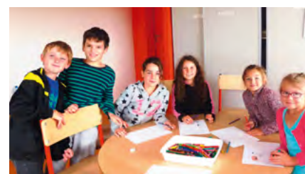
Une partie des jeunes journalistes.

«Le Journal des Enfants» a été terminé pour les vacances de Noël.