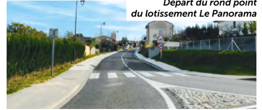
Départ du rond point du lotissement Le Panorama

Malgré tout ces travaux, nous déplorons un accident mortel qui s'est passé en juillet, en plein centre du village. La conductrice aurait été éblouie par le soleil et n'aurait pas vu la victime qui traversait. Un accident qui endeuille toute une famille et laisse la conductrice très choquée. La prudence est toujours recommandée en traversant le village, rien ne pourra remplacer une vigilance de tous les instants.