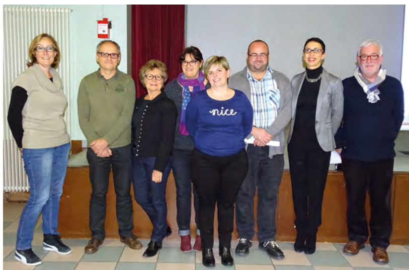
Une partie du Groupe de Propositions et de Contribution.

LES PREMIÈRES ACTIONS SONT MISES EN ŒUVRE, LES AUTRES SE POURSUIVront AVEC LE TEMPS