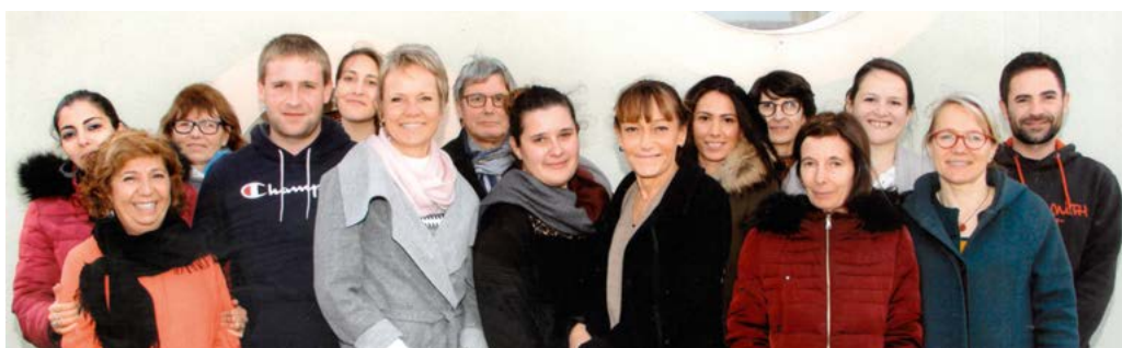
L'équipe école /ALAE de Paulhac!

boré, décoré et rédigé des cartes de vœux pour tous les habitants de leur village ! N'hésitez pas à leur répondre : les petits mots dans la boîte aux lettres de l'école sont toujours reçus et lus avec beaucoup de plaisir par tous les enfants. Nous vous souhaitons une très bonne année 2020 !