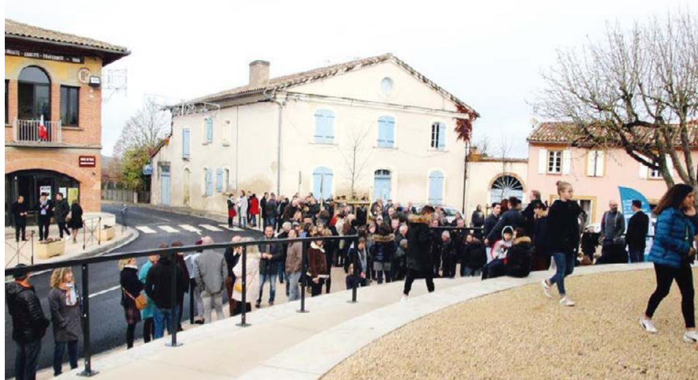
Beaucoup de monde pour répondre à l'invitation de la commune

LE SAMEDI 1 ER DÉCEMBRE RESTERA UNE DATE IMPORTANTE DANS L'HISTOIRE DE NOTRE VILLAGE. IL Y AVAIT, EN EFFET, FOULE, POUR INAUGURER LES TRAVAUX DE RÉAMÉNAGEMENT DE LA PLACE DES TILLEULS, AINSI QUE LES LOCAUX DE L'ESPACE DE VIE SOCIALE « SOUS LES TILLEULS ».