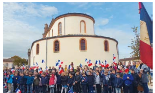
Les écoliers de Paulhac rendent hommages à nos poilus.