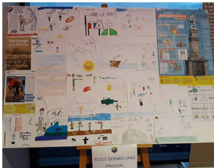
Les CM de l'école Georges LANG ont réalisé une fresque sur le thème de la 1 ère guerre mondiale qui a été exposé à Garidech lors d'une grande exposition de travaux scolaires