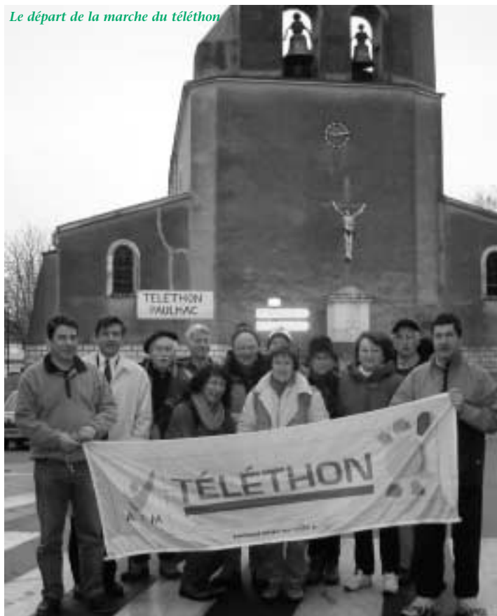
Le départ de la marche du téléthon