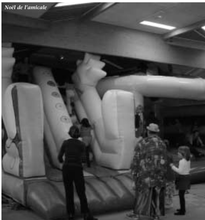
Noël de l'amicale