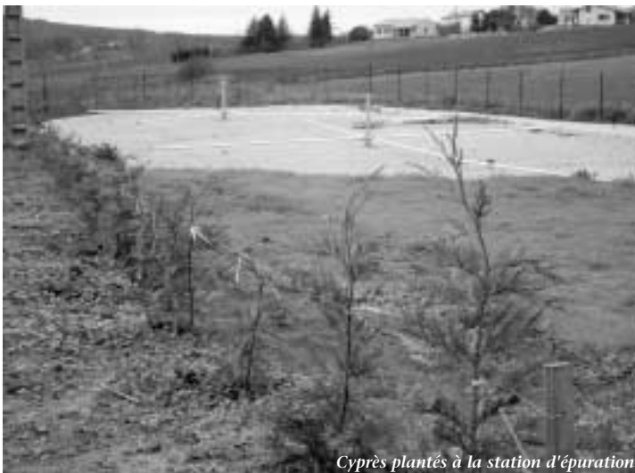
Cyprès plantés à la station d'épuration

Les plantations autour de la station d'épuration ont été réalisées conformément au planning prévu. Une haie de cyprès a notamment été plantée, et les espaces non occupés ont été engazonnés.