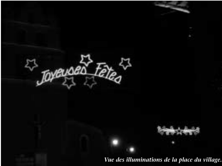
Vue des illuminations de la place du village.

Comme mentionné en juillet dernier, l'éclairage public de la place du village a été rénové. Des décorations lumineuses ont été acquises, puis complétées. L'ensemble permet de disposer d'un équipement satisfaisant, notamment au moment des fêtes. On peut ainsi en juger sur la photo prise durant des fêtes de fin d'année.